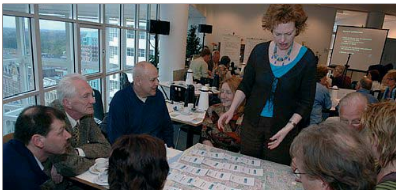
Uitleg over het keuzespel.

stand komen, mocht meer aandacht krijgen. 'Sloop alsjeblieft de oude architectuur niet te snel maar probeer nieuwe bestemmingen te vinden', zei een van de sprekers. Een aantal mensen kwam met een ander, praktisch advies voor het realiseren van meer woningen: bouw een extra laag op de bestaande huizen. Iemand stelde zelfs meerdere lagen voor: 'Zes, acht of tien verdiepingen, zodat het niet allemaal even hoog is.' En wat er ook gebeurt, houd rekening met lagere en midden-