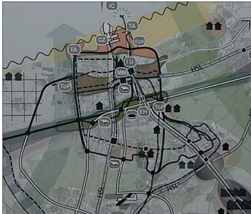
De visie op de regio in kaart gebracht.

Als het aan de deelnemers lag, krijgt de regio meer aandacht. 'Pas als het vervoer beter wordt, krijg je echt een blik op het noorden, oos-