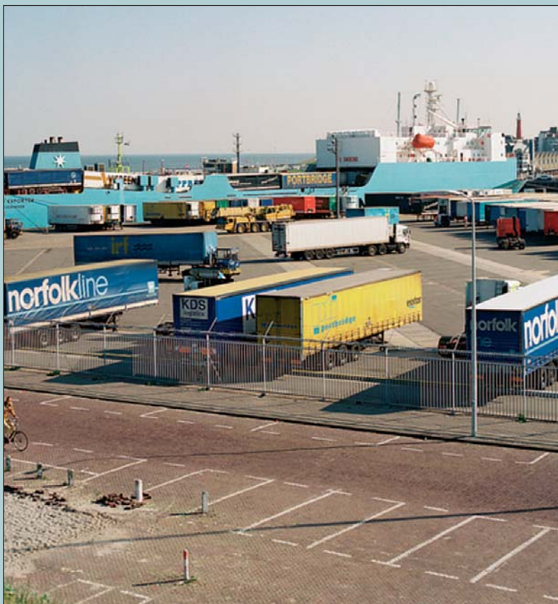
Het Norfolkterrein kan vanaf 2007 een nieuwe bestemming krijgen.

Norder voor om boven de Utrechtse Baan te bouwen en boven het spoor.