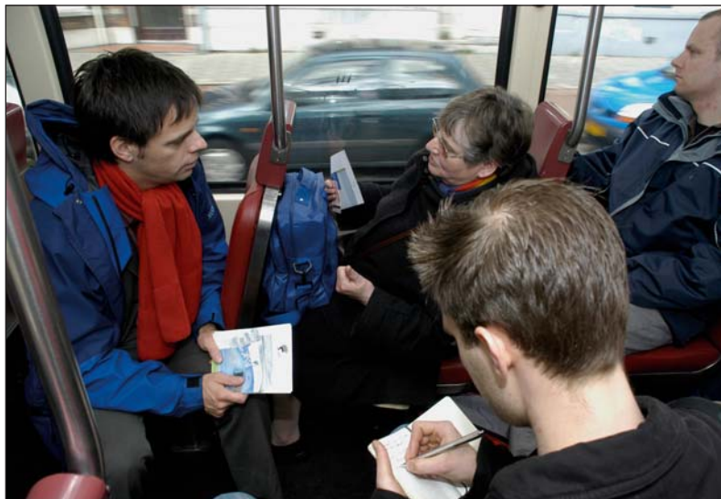
Wethouder Marnix Norder vraagt trampassagiers naar hun mening over Den Haag in 2020, tijdens het Rondje Den Haag op 14 april 2005.

Ze zullen het niet snel zeggen, maar eigenlijk zijn de Hagenaren best trots op hun stad. Op het vele groen, op de duinen, de zee en op de internationale uitstraling. Tijdens de gespreksronde over de Structuurvisie voor 2020 bleken dat allemaal zaken die men kostbaar vindt.