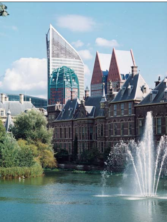
Gemengd stadsbeeld bij de Hofvijver.

De wateropgave maakt ook de kwestie-Schevingen complex: kustverzwaring, betere aansluiting bij Den Haag, sluiten van de rondweg, verschillende identiteiten. Bruno Tideman vond dat de zee best meer aanwezig kon zijn in het statige Den Haag. 'Er is nota bene een Zeestraat in het centrum. Dus historisch gezien is de relatie er.' Wethouder Norder toonde zich een voorstander van ongelijkvloerse kruisingen bij het sluiten van de ring. 'Dan blijft de lokale infrastructuur in tact en kan de Hagenaar via zijn eigen sluiproutes naar zee.' De ongelijkvloerse kruisingen, de (ondergrondse) opslag van water en de hoogbouwplannen brachten Asselbergs op het idee van een driedimensionale structuurvisie. 'Je kunt dat niet allemaal op platte kaarten laten zien.' Dan moet je ook de totale ambitie driedimensionaal maken, vond Aat Maaswinkel van Vestia, verwijzend naar de 37 duizend nieuwe woningen. Schröder: 'Ik heb er nu geen gevoel bij of dat realistisch is. Het is een politiek getal.'