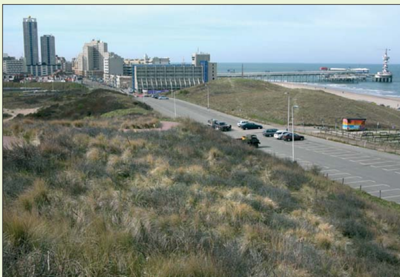
Zicht op Scheveningen-Bad vanaf het Zwarte Pad.

verrommeld. 'Maak van Kijkduin alsjeblieft geen tweede Scheveningen met al die flats en casino's en bioscopen', viel te beluisteren tijdens de derde avond. Daar was iedereen het mee eens: aan de kust moet kleinschaliger worden gebouwd.