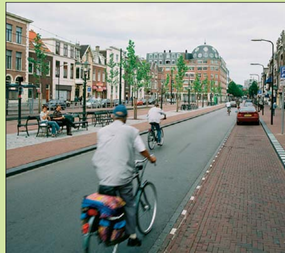
Fietsers moeten vrij baan krijgen in Den Haag.