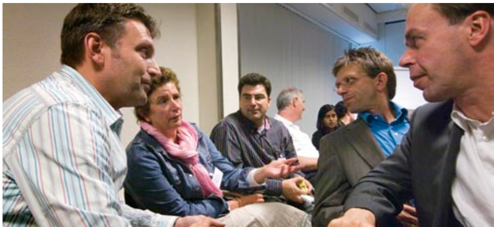
Overleg tijdens workshop 8.

‘Bij de workshop over sociaal ondernemerschap heb ik geleerd wat het belang is van een sleutelfiguur binnen de gemeente, iemand die als breekijzer fungeert. Er was een man uit Dordrecht die binnen de gemeente het sociaal ondernemerschap op de agenda heeft gezet. Iedereen haatte hem in het begin, vertelde hij, gewoon omdat hij de boel wakker schudde. Er was ook een sociaal ondernemster, met twee goedlopende vestigingen, terwijl ze voor een rendabel bedrijf vijf vestigingen nodig heeft. Het lukt haar niet om bij andere gemeenten binnen te komen. Zij zou dus baat hebben bij zo’n sleutelfiguur. Nu ga ik haar helpen, hebben we afgesproken. Ik stel mijn netwerk beschikbaar om haar bij de gemeente Utrecht binnen te loodsen.’